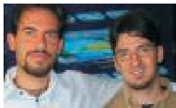
a cura di Carlo Fiorenza e Gabriele Curci (CETEMPS L'Aquila)