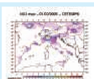
LA PREVISIONE DELLA QUALITÀ DELL'ARIA

delle città. Nella zona urbana vengono emessi gli ossidi di azoto che, trasportati dai venti nelle zone suburbane circostanti, possono entrare in contatto con gli idrocarburi emessi dalla più abbondante vegetazione tipicamente presente fuori città. Questo comporta, ancora una volta, condizioni molto favorevoli per la formazione di ozono. Un'ulteriore complicazione è costituita dalle modificazioni introdotte dall'uomo sulla distribuzione della vegetazione all'interno e all'esterno delle aree urbane. Per ironia della sorte, un'area interessata da rimboscimento potrebbe tramutarsi in un reattore chimico per la produzione del nocivo ozono se esposta all'afflusso di ossidi di azoto da una città posta alla "giusta" distanza. A questo punto, ci si potrebbe chiedere se a conti fatti sia benefico per l'ambiente il nostro intervento con rimboscimenti o la conservazione di oasi naturali. Ovviamente la risposta dipende dal caso specifico e comunque non intendiamo demolire gli sforzi atti a conservare la flora e la fauna della nostra terra. Vogliamo soltanto puntualizzare che interventi sulla natura di qualsiasi tipo, anche se fatti con le migliori intenzioni, possono portare ad effetti addirittura opposti rispetto a quelli desiderati, perché assoluta-