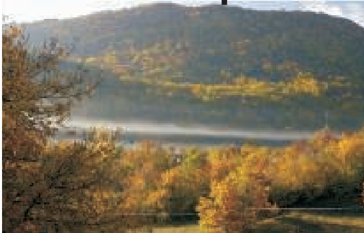
Nella foto grande, zona boschiva ai Piani di Pezza, foto di Enrico Di Gregorio. In alto, la mappa di concentrazione al suolo di biossido di azoto sull'Italia.