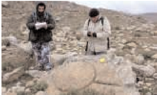
A sinistra nell'altra pagina, la zona dell'Osservatorio sotto la Tavola. A sinistra e in alto, i membri della spedizione al lavoro. A destra, il villaggio.